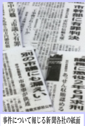
事件について報じる新聞各社の紙面